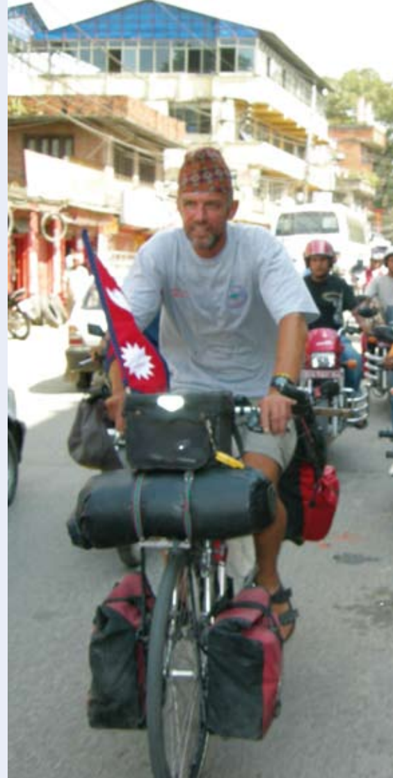
Op weg naar het opvangcentrum in Nepal.